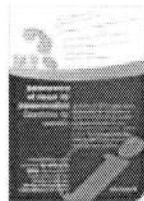
(flyer de présentation)

Ces lettres sont le fruit de notre collaboration avec la FSFP (Fédération Suisse pour la Formation des Parents) et de la FAPERT (Fédération des Associations de Parents d'Elèves de la Suisse Romande et du Tessin).