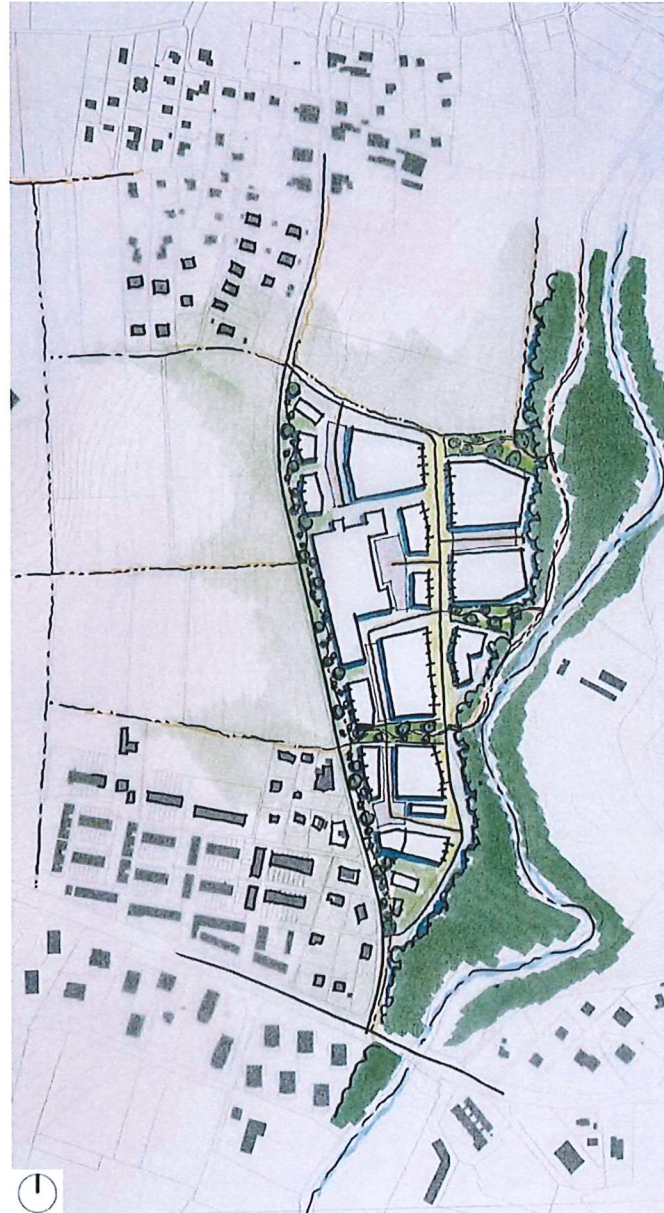
Fig. 4 : Rappel : esquisse de la vision communale pour le secteur « La Pale ».