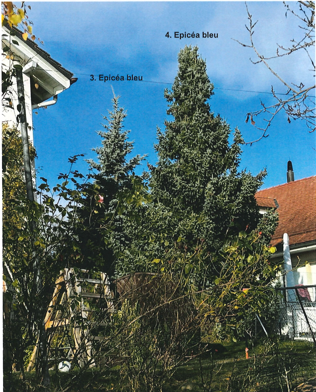
4. Epicéa bleu